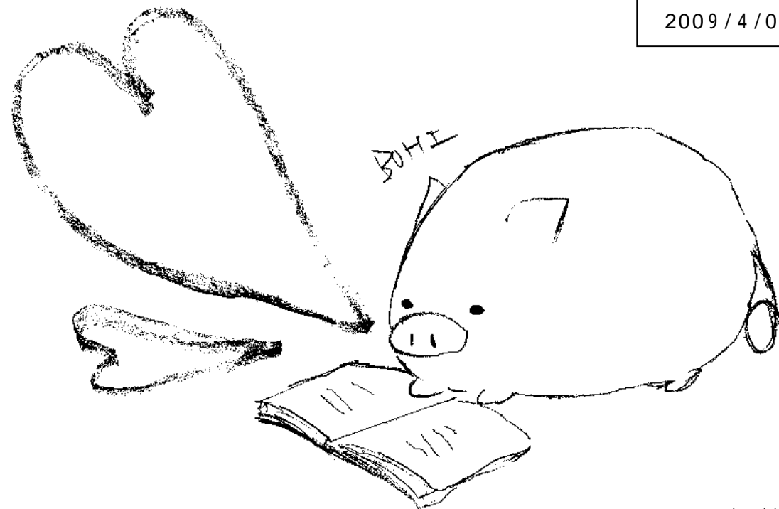
イラスト 匿名希望さん