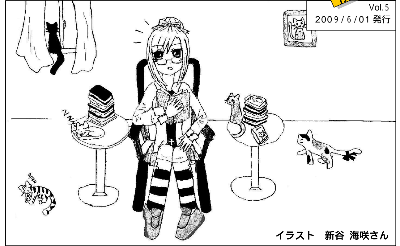
イラスト 新谷 海咲さん