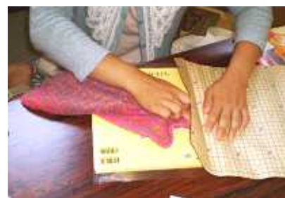
第1回装備体験の様子