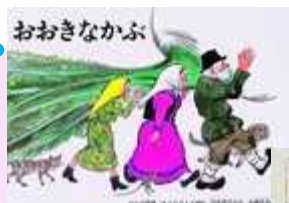
「おおきなかぶ」 A.トルストイ 再話 福音館書店