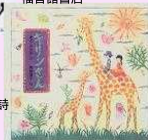
「キリンさん」 まど みちお / 詩 小峰書店