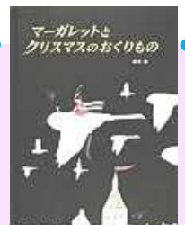
「マーガレットと クリスマスのおくりもの」 植田 真津作 あかね書房