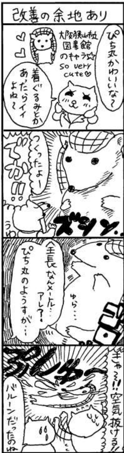
4コマまんが:スタッフR・K 作