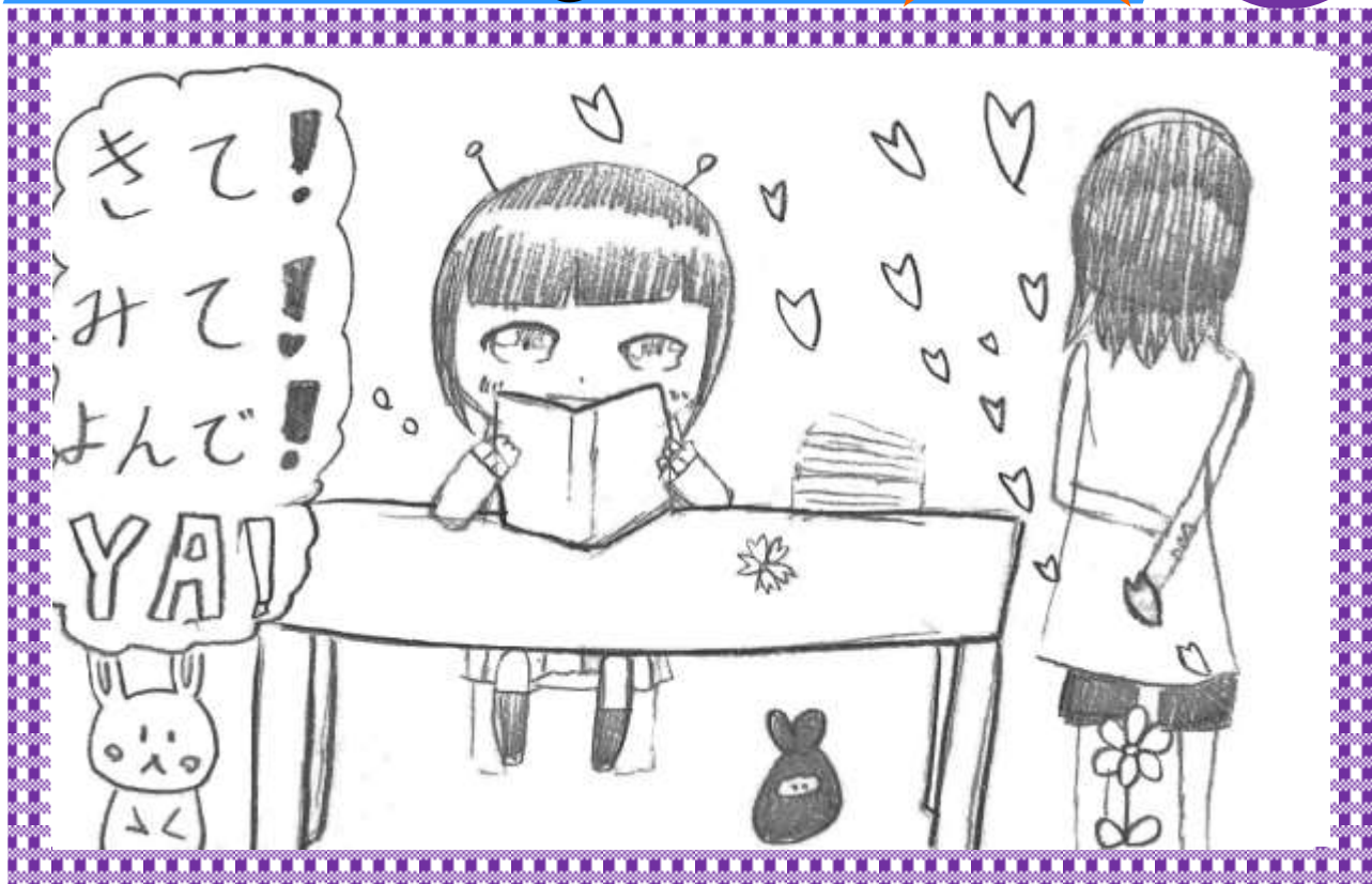
イラスト ヒラとけっこんする!!さん